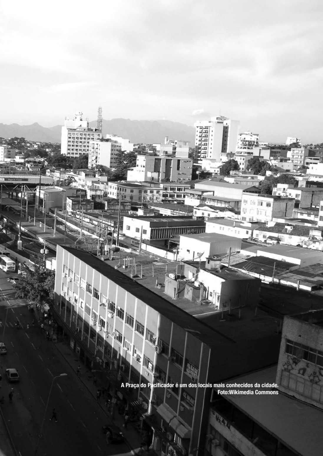
A Praça do Pacificador é um dos locais mais conhecidos da cidade.